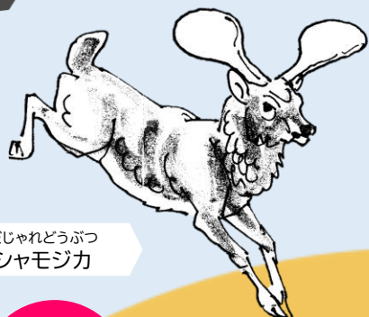
だじゃれどうぶつ シャモジカ