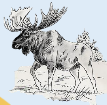
実際のどうぶつ ヘラジカ